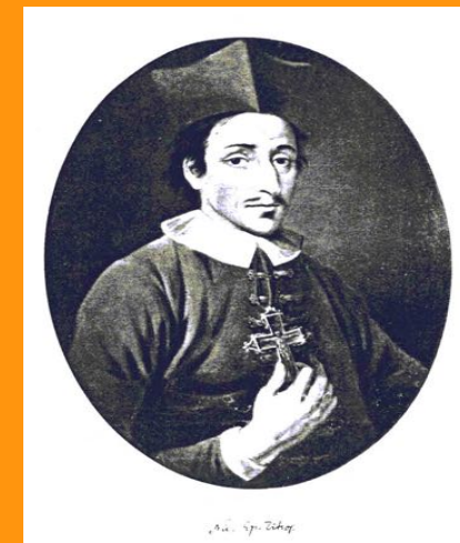
Bildunterschrift: Nic(olaus) Ep(iscopus) Titio(p)olis

Der Kardinal-von-Galen-Kreis hat die Rückseite der Galen-Medaille mit dem Wappen des sel. Niels Stensen versehen lassen und ihn zum zweiten Patron des Vereins gewählt.